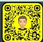
Espace Ados Champforgeuil espaceados71530