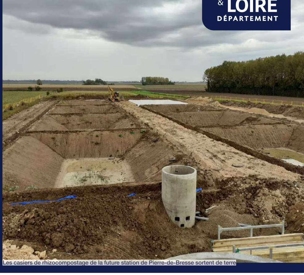
Les casiers de rhizocompostage de la future station de Pierre-de-Bresse sortent de terre

Les missions de soutien et d'accompagnement des collectivités territoriales sont regroupées au sein de la Direction accompagnement des territoires (DAT) pour être à votre écoute et venir en appui sur vos projets