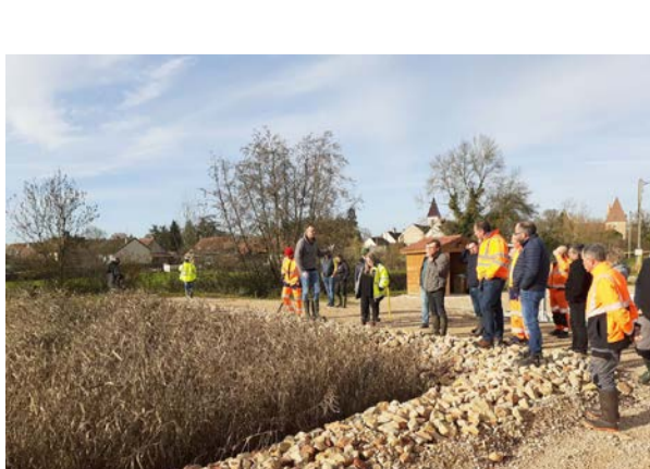
Formation filtre planté de roseaux à Saint-Léger les Paray et Messey-sur-Grosne

Pour plus d'informations sur l'eau : • le site du Département de Saône-et-Loire • le site des services de l'État en Saône-et-Loire