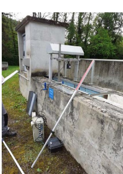
Contrôle d'un débitmètre et d'une sonde de niveau